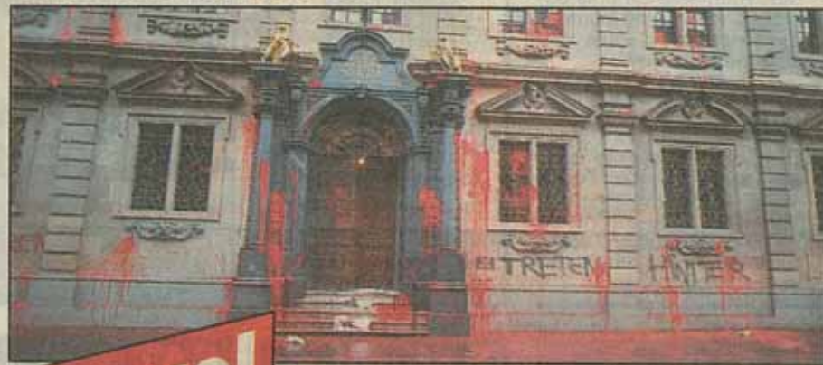
Von Chaoten mit Farbe verschmiert: So sieht das Zürcher Rathaus im Moment aus – nicht gerade eine Visitenkarte für die Stadt. Rechts: Damit der Stadtrat klar sieht: Jürg und Gregor (vorn) beim Fensterputzen.